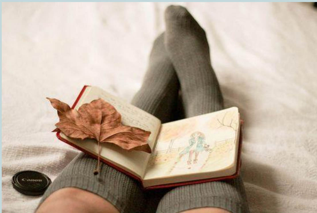
Il Diario di M.